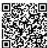
アンケート回答 QR コード