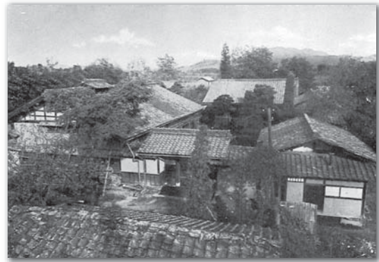
長土呂の生家