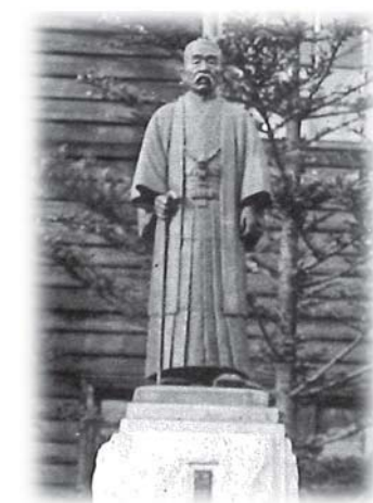
岩村田中学校に建立された寿像 この像は戦争中に供出されてしまい、現在岩村田高校内に立つ像は平成2年に再建されたものである。 （昭和17年度岩村田中学校卒業アルバムより）