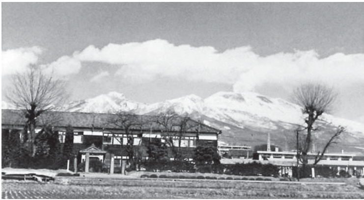
旧制岩村田中学校（『岩校六十年誌』より）

さらに、岩村田実科女学校や岩村田中学校（現岩村田高校）の創立、長野県立図書館の設置、信濃教育会館の建設、教員互助会の設立にも貢献した。