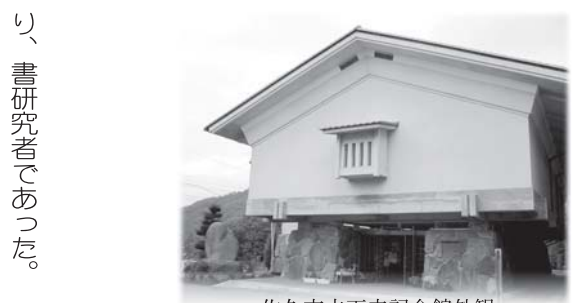
佐久市立天来記念館外観

一九三〇（昭和5）年、東京渋谷区代々木に「書学院」が完成した。ここには若き書家たちが集い、上田桑鳩・桑原翠邦・金子鷗亭・手島右卿ら、戦後の書道界を背負う人たちが育った。一九三二（昭和7）年、東京美術学校（現東京芸術大学）師範科・習字科の講師となる。一九三六（昭和11）年、鎌倉にも書学院を完成させたが、この工事は大工をはじめほとんどの職人を郷里協和村から呼び、郷里とのつながりをさらに深めた。