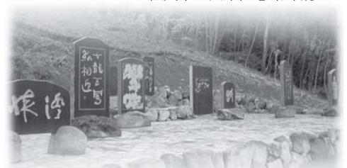
天来生家の裏山に造られた天来自然公園