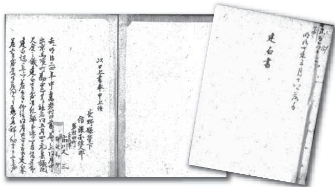
1874（明治7）年に提出した建白書

根々井塚原村（現佐久市）や追分村（現軽井沢町）等の仲間数人と、一八七〇（明治3）年に二回、その