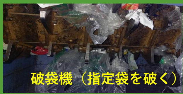
破袋機 (指定袋を破く)

収集したものは最終的に「容器包装リサイクル協会」で 再資源化 されています。 市では、協会へ引き渡す前に事業者へ委託し「 中間処理 」を行っています。