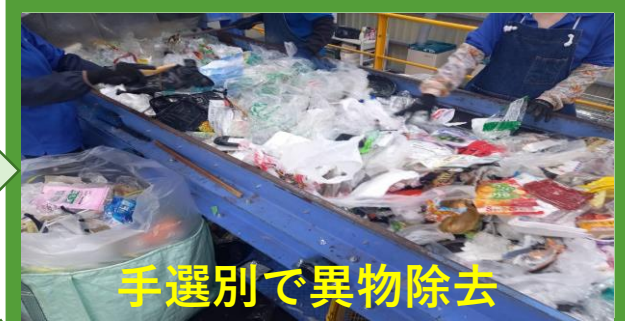
手選別で異物除去