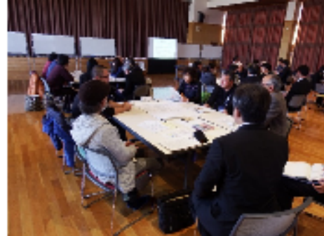
<班ごとの話し合い>