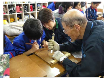
ふれあい交流集会