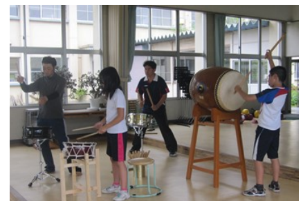
地域講師を招いてのクラブ活動(太鼓クラブ)