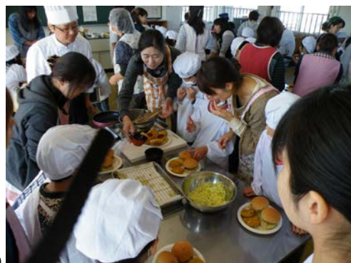
自分たちも関わって育てた麦・ジャガイモ・菜種油を使ってコロッケを作る親子学習(3年)