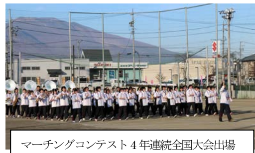
マーチングコンテスト4年連続全国大会出場

長野県と協定を結んだアダプトシステム活動として地域の美化に貢献している。生徒会美化委員会を中心に学校敷地北側の道路脇に花の栽培を推進。佐久市「緑の街づくりコンクール」で最優秀賞を受賞。