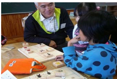
地域の教育力を活かす場 地域講師に学ぶ「青沼共有学習会」