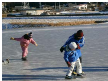
佐久スケートの伝統を受け継ぐ 「田んぼリンク」で、スピードスケート滑走をする児童ら