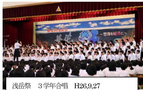
浅岳祭 3学年合唱 H26.9.27