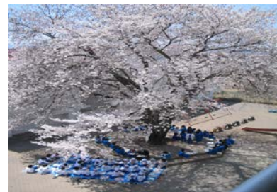
平根小自慢の桜の木

近くの平尾富士山にちなみ、富士山のような高い志を持つ子どもの育成を期して昭和40年に制定