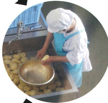
みんなのことを想い給食を つくる給食センターのみなさん

コロッケづくりのポイント！ みまきはら しろ あじ 御牧原の白いものがシンプルに つたわるように、味付けは塩と あじつ しお こしょうのみにしています！