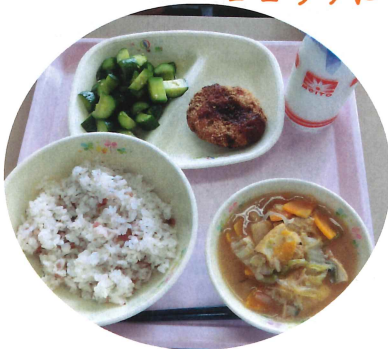
しゅうかく 収穫したじゃがいもが コロッケになったよ！

しゅうかく のうか 収穫したことで農家のみなさんの くろう たいけん おも 苦労も体験できたと思うので毎日 きゅうしよく かんしゃ きも の給食を感謝の気持ちをもって た べて くだ さい！