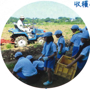
しゅうかく ようす 収穫の様子