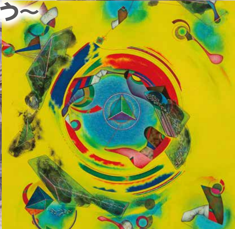
左上：小堀進《北アルプス》 右上：北村西望《猫》 左下：遠藤彰子《私の街》 右下：奈良達雄《マクロタイム“エ”》(すべて部分)