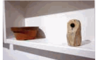
「ジブンミンゾクをつくろう!」参考写真

1982年長野県生まれ。 2006年東京造形大学造形学部彫刻専攻卒業。 国内の個展・グループ展で作品を発表しているほか、海外のアートフェア等にも多数出品している。