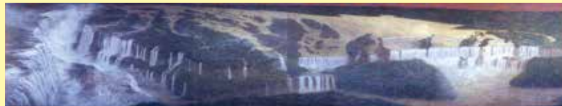
松本哲男《イブラス (ブラジル)》