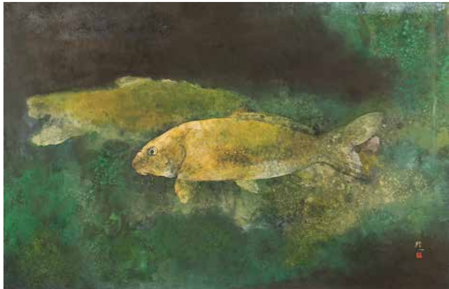
土屋禮一《鯉》2012年制作

主催：佐久市・佐久市教育委員会 協力：株式会社美術年鑑社 後援：佐久ケーブルテレビ・エフエム佐久平 佐久市民新聞・佐久市立近代美術館友の会