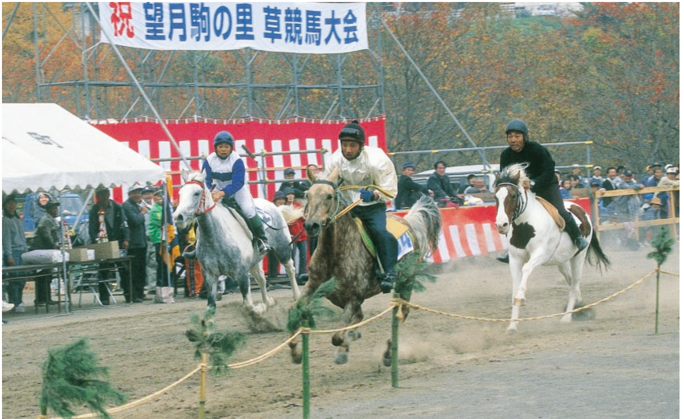
▲望月駒の里草競馬大会（毎年11月3日に町総合グラウンドにて開催されています）