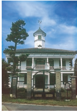
旧中込学校 (佐久市)