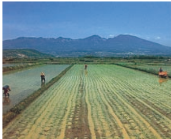
五郎兵衛新田 (浅科村)