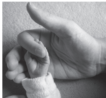
子育てにやさしいまちを

Q ◆高校生の通学支援について 子どもが高校生になると送迎が課題になる家庭が多い。望月から岩村田方面へはバス代が高額のため、ほとんどが自家用車で送迎している。進学先を決める際にも影響している。過疎債で補助している市町村もあるが通学補助を検討できないか。 A 高校選択には一定の自由が認められているので、通学補助は検討していない。 Q ◆安心な出産・子育てについて 産後ケアのために助産院など保険適応外の施設に使える助成券は、お母さんの心身変化への支援として有効だと考えるが、佐久市でも発行の検討は。 A 保健師や助産師による家庭訪問や相談事業があるため、助成券は検討していない。 Q 佐久市の子育て情報サイト「パママフレ」は、詳しい情報は佐久市のHPへ戻ってくる仕組み