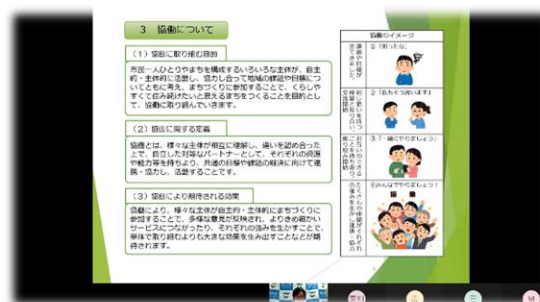
オンライン説明会