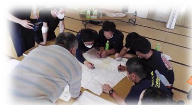
常和区 消防団と協働で 防災マップづくり