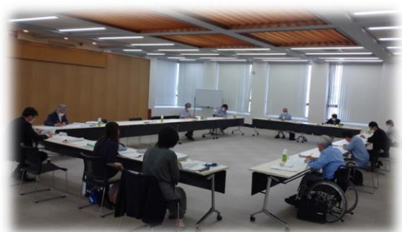
協働のまちづくり推進会議