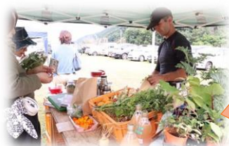
ツキヒトマルシェ 地元で採れた 有機野菜を販売