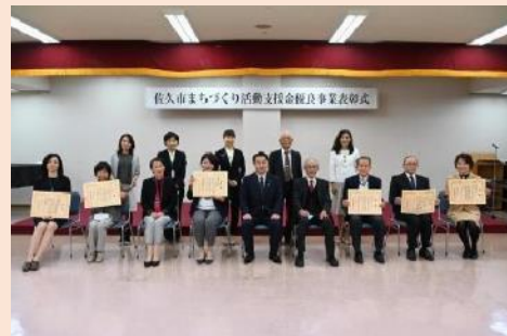
令和元年度優良事業表彰式の様子

佐久市まちづくり活動支援金の優良事業として表彰された活動を市広報紙サクライフ特集記事で紹介しています。