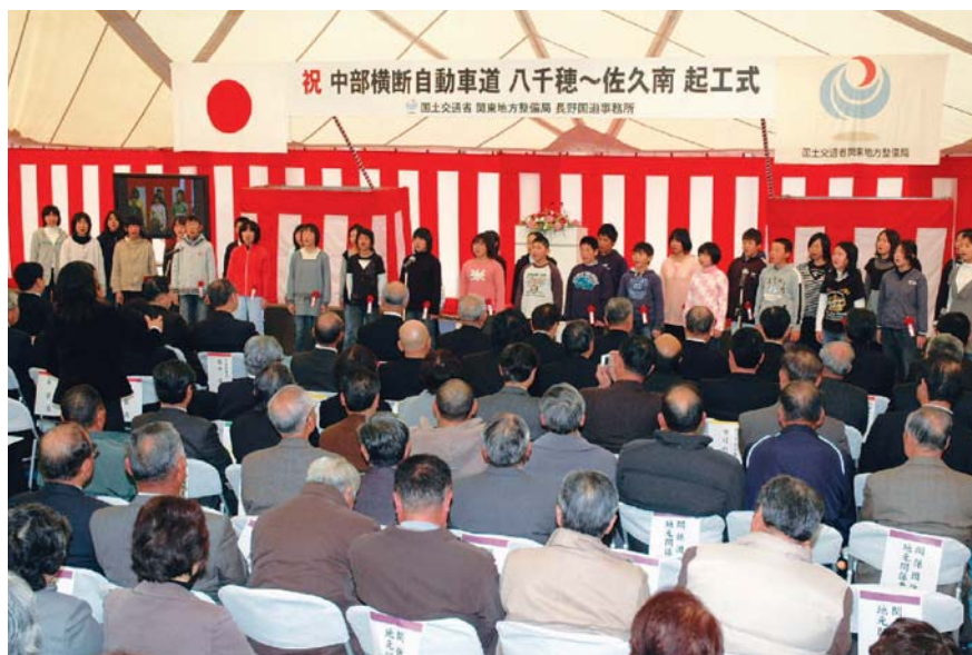
地元切原小学校児童も参加して行われた起工式

なお、中部横断自動車道の開通予定は佐久JCT～佐久南ICが平成22年度、佐久南IC～八千穂IC間が平成27年度となっています。