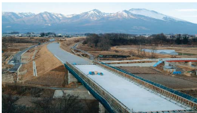
工事の進む佐久JCT～佐久南IC間（湯川橋梁）