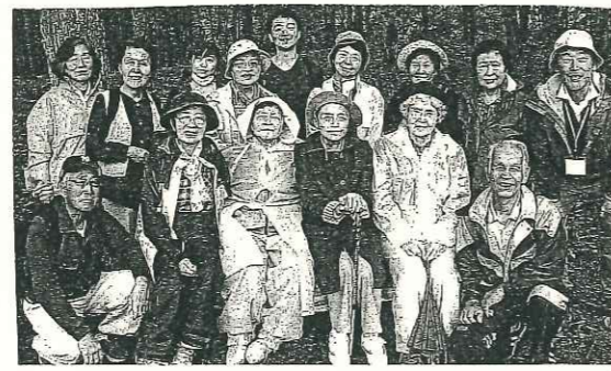
春日の森で森林セラピー体験した仲間たち