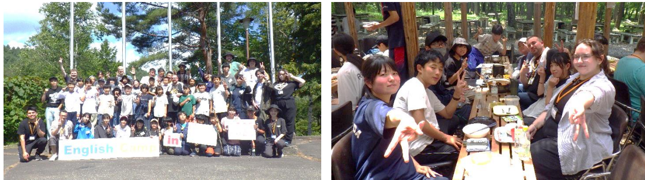
English Camp 活動の様子