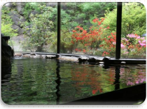
・トレーニング後は、疲労回復など効能豊かな天然温泉施設でリラックスできます。