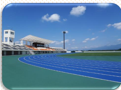
佐久総合運動公園 陸上競技場