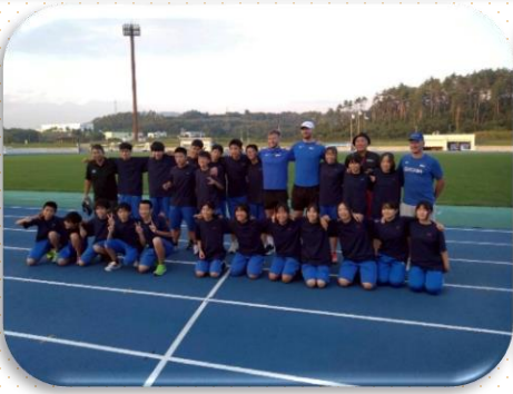
・東京2025世界陸上では、エストニア共和国の選手が事前合宿を行いました。