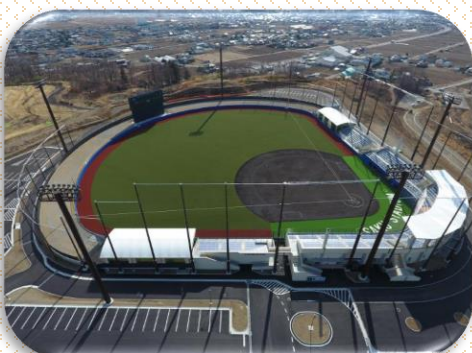
佐久総合運動公園 野球場