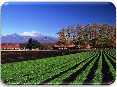
・全国トップクラスの日照時間を誇ります。 全国平均日照時間：1892.1時間 佐久市日照時間：2244.9時間【2024年調べ】