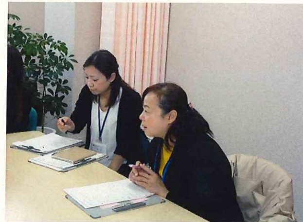
※生活相談員による相談の様子