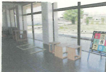
遊びながら運動できるスペースも。