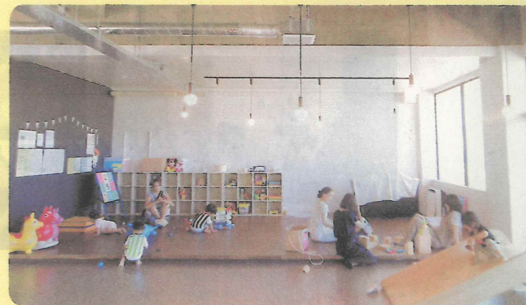
冷暖房完備で快適なプレイルーム

いつも利用させてもらっています。家では動く範囲に限られるのでこういう施設は本当に助かります!特に今年は猛暑であまり外で遊べなかったので動き回りたい年頃の息子にはとても良かったです!スタッフの皆さんもとても話しやすく気軽に相談などできるのも県外から来た私にとって本当に助かっています。(町内の方)