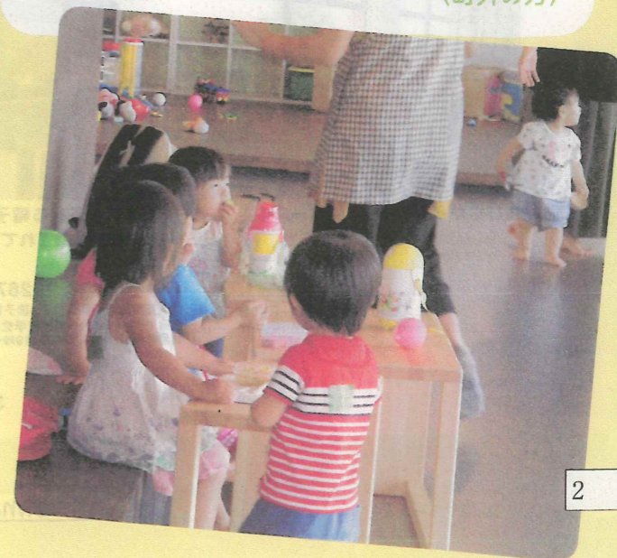
★みんなで仲良くお昼ごはん☆

リトミックなど、子どもと体を動かしたりすることができてとても良いです。毎月の行事を楽しみにしています。(町内の方)