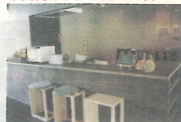
お弁当を温める電子レンジや調乳用のお湯など用意されていて便利です。