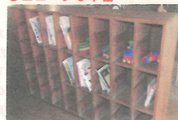
小学校時代の「げた箱」を「本棚」として再利用しています。