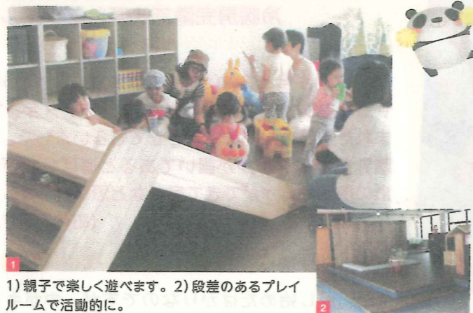
1) 親子で楽しく遊べます。2) 段差のあるプレイルームで活動的に。