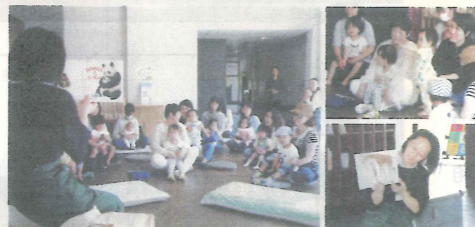
親子で読み聞かせを楽しめます。

佐久穂町の小中学校統合に伴い2015年に閉校した旧佐久中央小学校に今年4月「さくほっこ」が開設しました。旧校舎の昇降口をプレイルームとして整備し、北校舎は乳幼児健診エリア、南校舎は学童エリアとして、一体的に子育てを支援する場所へと生まれ変わりました。