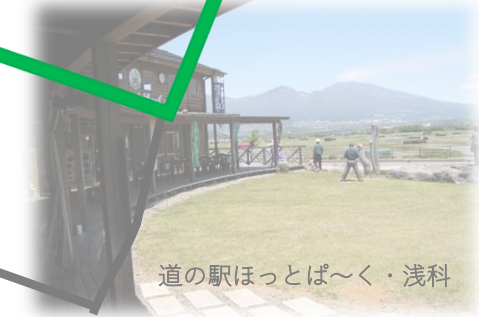
道の駅ほっとば〜く・浅科