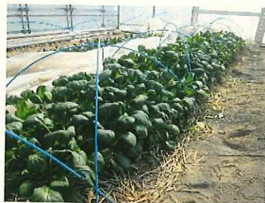
↑ 2/13 コマツナ