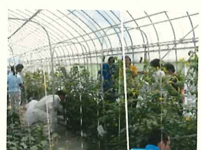
野菜栽培講習会の様子