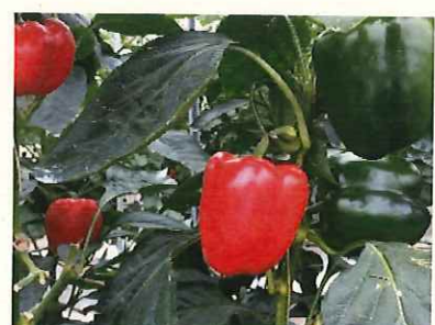
↑成熟したパプリカ