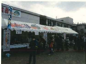
↑農業祭のスープ提供