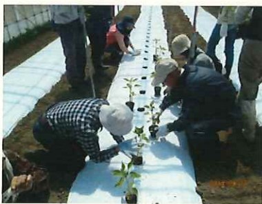
↑栽培講習会での定植