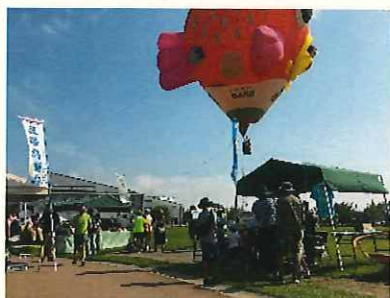
↑熱気球体験搭乗会場

7月3日、8月14日、9月22日 熱気球体験搭乗イベントに合わせた、農産物PRとスープの提供