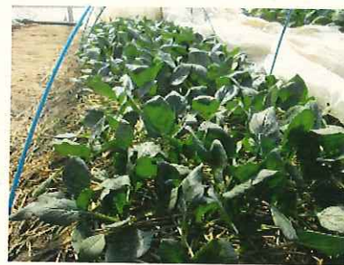
↑ 2/13 ホウレンソウ