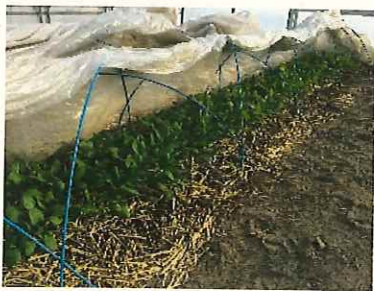
↑ 1/18 コマツナ