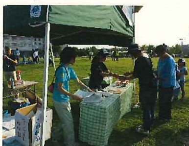
↑スープとレシピの提供