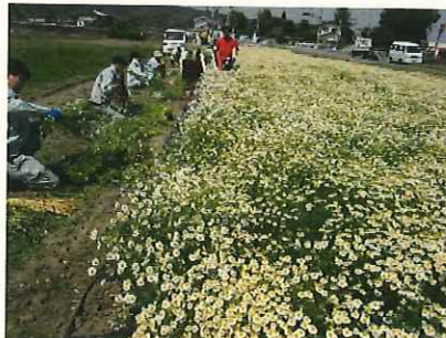
↑ 機械収穫と結束作業