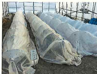
↑ 2/13 シート被覆