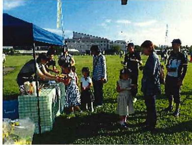
↑佐久古太きゅうりの試食提供