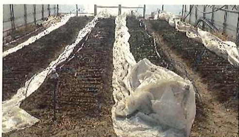
↑ 12/11 発芽