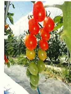
↑ シシリアンルージュ