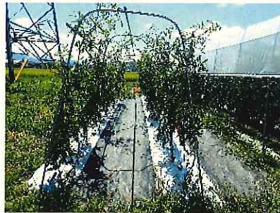
↑ 9/1 収穫期