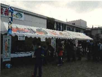
↑農業祭のスープ提供