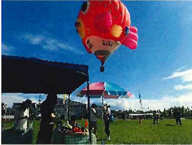
↑熱気球体験搭乗会場

7月15日、8月12日、9月9日 熱気球体験搭乗イベントに合わせた、農産物PRとスープの提供