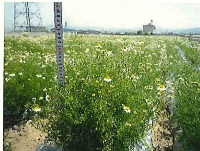
↑ 5/12 開花