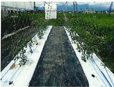
↑ 7/15 生育初期