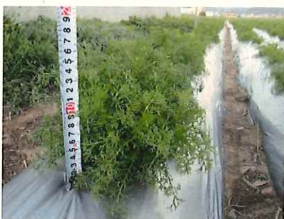
↑ 4/18 開花前