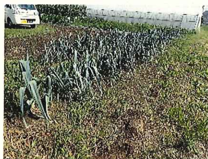
↑ 9/1 生育中期