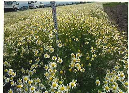
↑ 5/30 刈取り