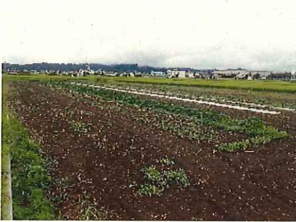
↑ 播種後 30 日

カモミールが全面マルチによる栽培をしていたことから、雑草の発生が少なく、果実が日焼けの被害を受けるものが発生した。