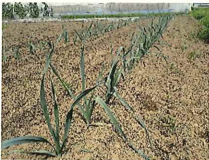
↑ 7/15 生育初期

日本のネギと違い、加熱調理により食することができるネギであり、加熱により甘みと風味が出る。