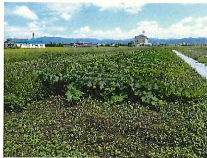
↑ 播種後 50 日