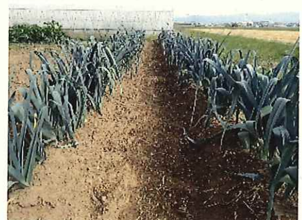
↑ 10/11 生育後期