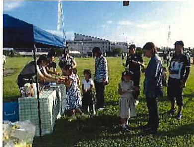
↑佐久古太きゅうりの試食提供