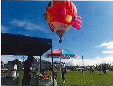
↑熱気球体験搭乗会場

7月22日、8月11日 熱気球体験搭乗イベントに合わせた、農産物PRとスープの提供