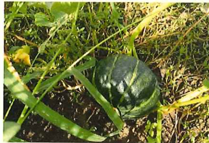
↑ 播種後 60日