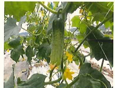
↑ 佐久古太きゅうり