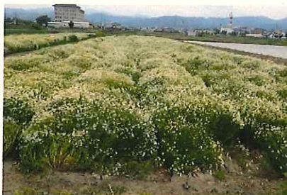
↑ 5/23 開花