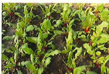
↑ 1/24 葉大根