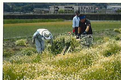
↑ 6/5 バインダー刈取り