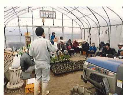
野菜栽培講習会の様子