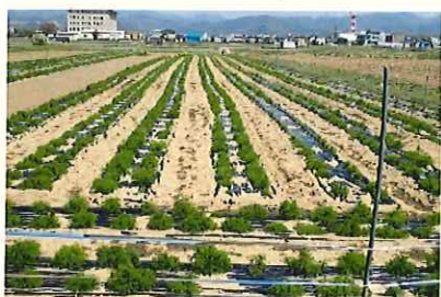
↑ 4/20 生育

昨年度と比較して、定植株数は前年同数であるが、栽培面積は1.5倍、収穫量も1.5倍となった。平うねマルチにより株間が広がったことから、一株が大きく成長したと考えられる。