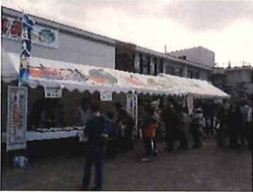
↑農業祭のスープ提供