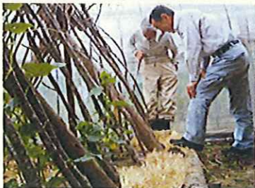
栽培者への聞き取り