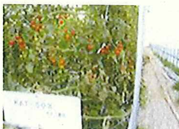
斜め仕立てでの栽培