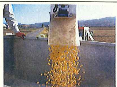
収穫されたナカセンナリ