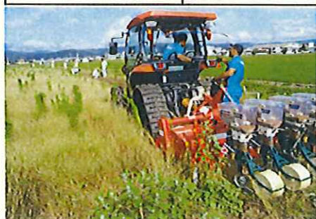
耕うん同時うね立ては種