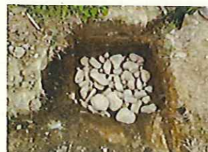
浸透確認後、50cm埋戻し