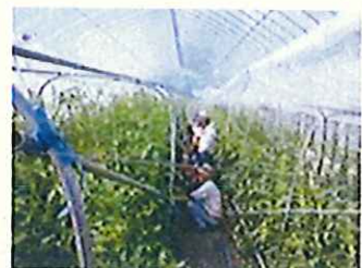
現地での品種調査の様子