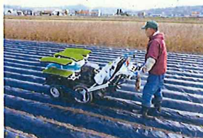
野菜用定植機による機械定植