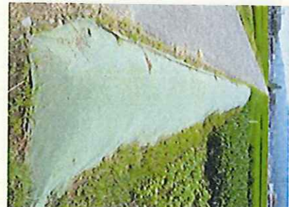
シート内が雑草繁茂により膨らんでいる