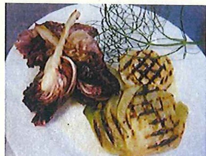
フィノッキオとラディッキョのグリル (試作)