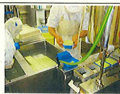
あやみどりを使用した豆腐加工