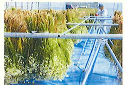
刈取り後の乾燥の様子