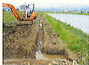
排水路と浸透樹の接続