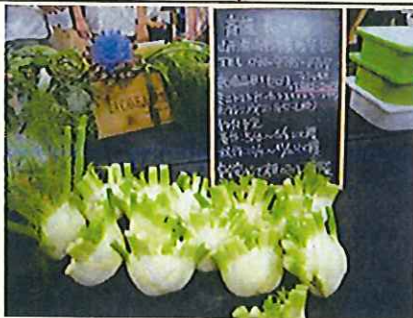
視察先での出荷の様子