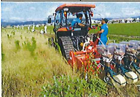
耕うん同時うね立ては種