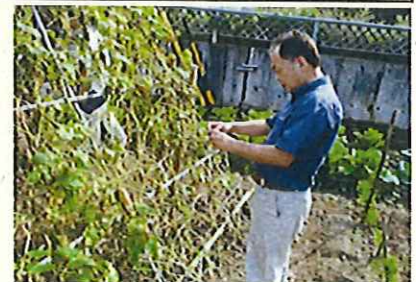
信州の伝統野菜選定委員会の視察