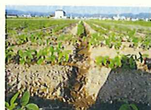
排水良好なため湿害無し