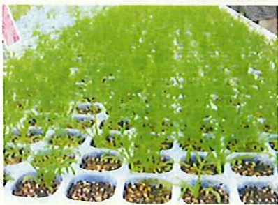
機械は種によるセルトレイ育苗