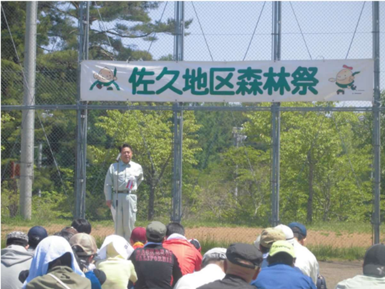
平成 29 年 5 月に佐久市臼田地区で、佐久地区森林祭が開催されました (佐久市長による挨拶)