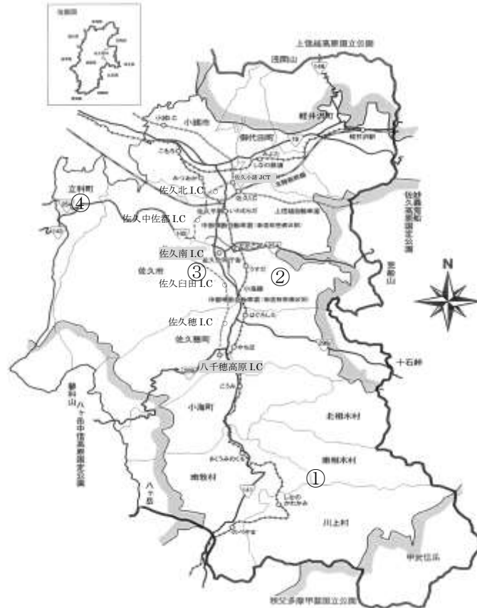
県自然環境保全地域 及び県郷土環境保全地域

当地域は、上信越高原国立公園、秩父多摩甲斐国立公園、八ヶ岳中信高原国定公園、妙義荒船佐久高原国定公園、長野県自然環境保全条例に基づく県自然環境保全地域（天狗山）及び県郷土環境保全地域（新海三社神社、貞祥寺、津金寺）、鳥獣の保護及び管理並びに狩猟の適正化に関する法律に基づく鳥獣保護区、並びに環境省が自然環境保全基礎調査で選定した特定植物群落を含むため、「8 環境保全その他地域経済牽引事業の促進に際し配慮すべき事項」に記載する。なお、当地域には、自然環境保全法に基づく原生自然環境保全地域及び自然環境保全地域、絶滅のおそれのある野生動植物の種の保存に関する法律に基づく生息地等保護区、自然再生推進法に基づく自然再生事業の実施地域、自然公園法に基づく県立自然公園、生物多様性の観点から重要度の高い湿地及びシギ・チドリ類渡来湿地に指定等されている地域及び国内希少野生動植物種の生息（繁殖・越冬・渡り環境）・生育域等は存在しない。