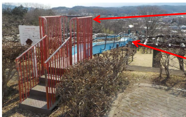
しゅっぱつ だ い 出 発 台