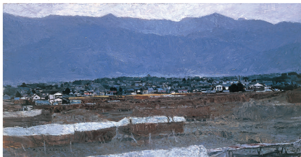
山下大五郎《山づく》1981年

※新型コロナウイルス感染症対策を実施しながら開館しています。ご来館の際は、マスクの着用、手指の消毒、体調チェックシートへの記入等にご協力をお願いいたします。