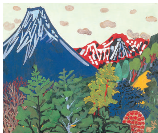
片岡球子《雌阿寒岳と阿寒富士》1971年