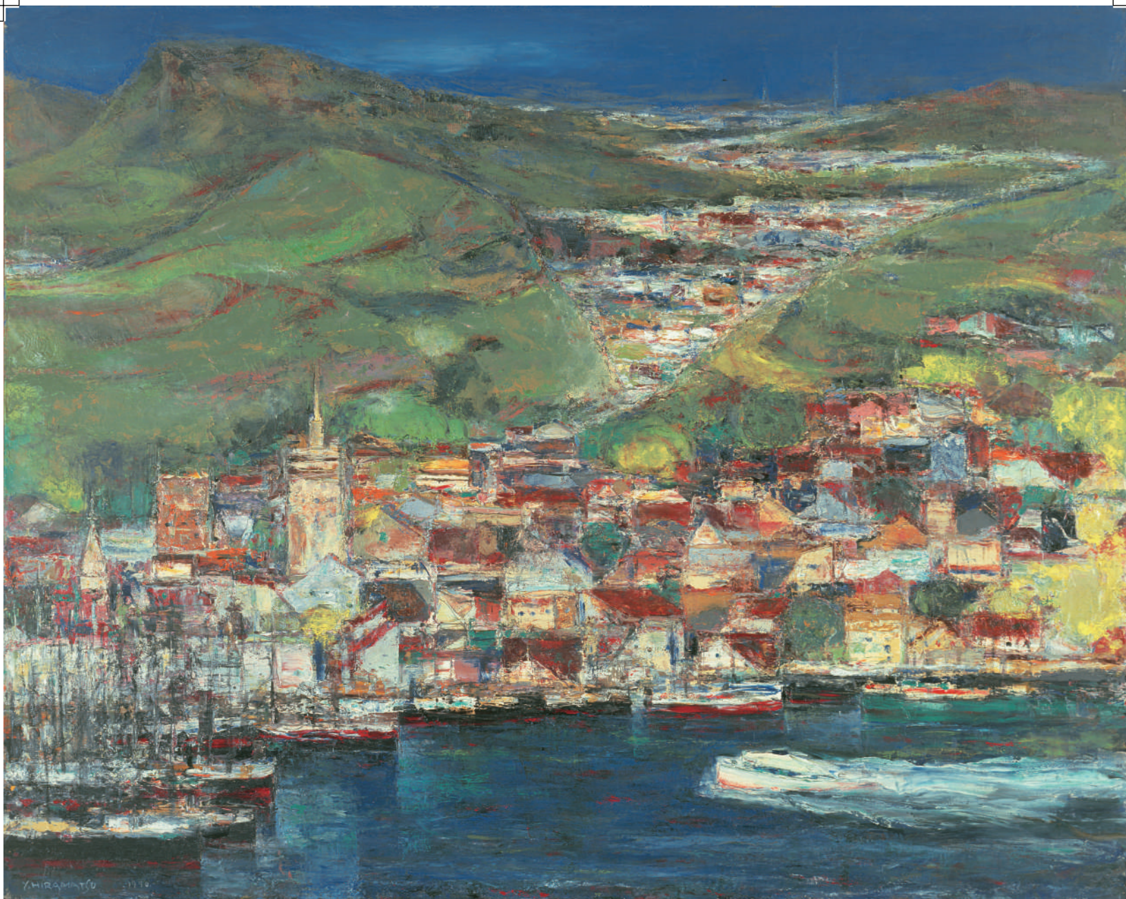
平松譲《長崎の丘》1990年