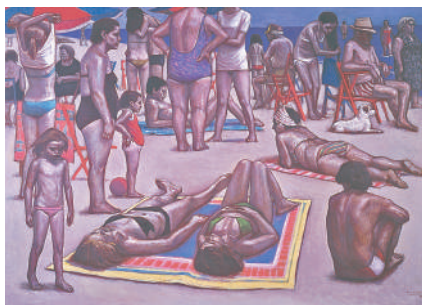
相笠昌義《アリカンテ海岸》1981年