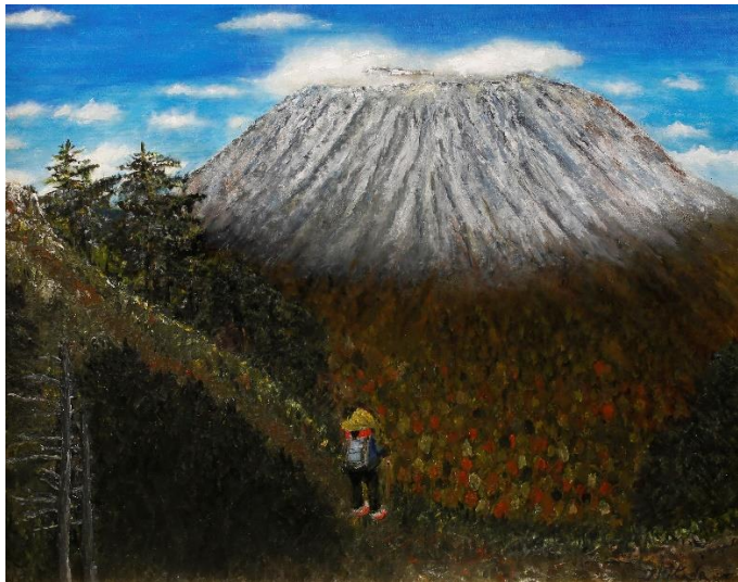
平面部門 No.39 北田 敏信 《浅间山の初冠雪》 72.7×91.0 油彩