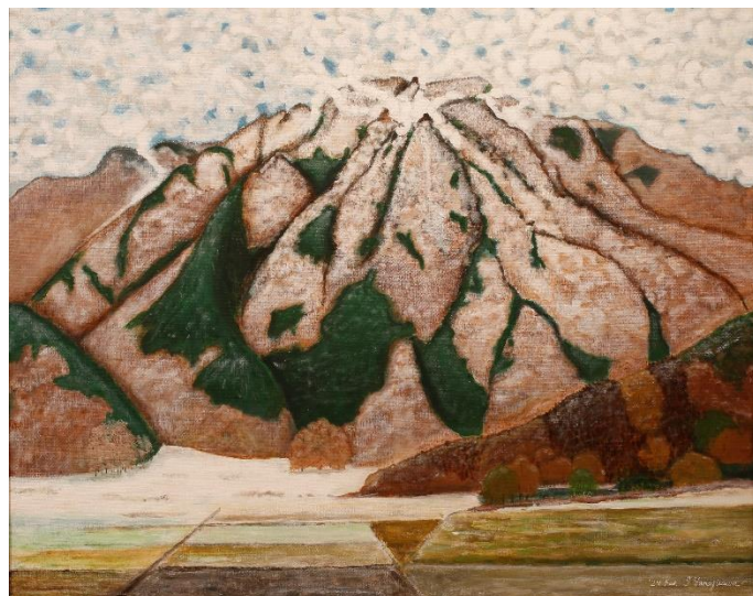
平面部門 No.17 柳澤 郁夫 《降雪の独鈷山》 72.7×91.0 アクリル