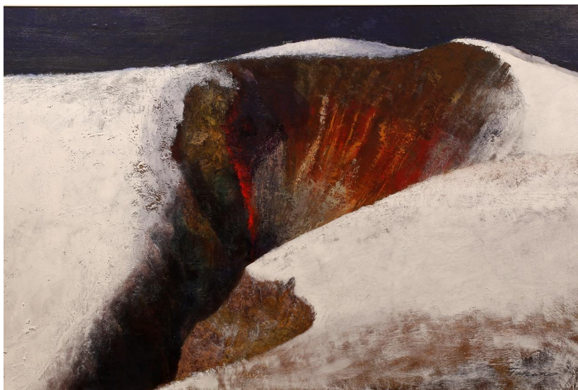
平面部門 No.4 鷹野 秀樹《玄冬》 97.0×145.5 油彩