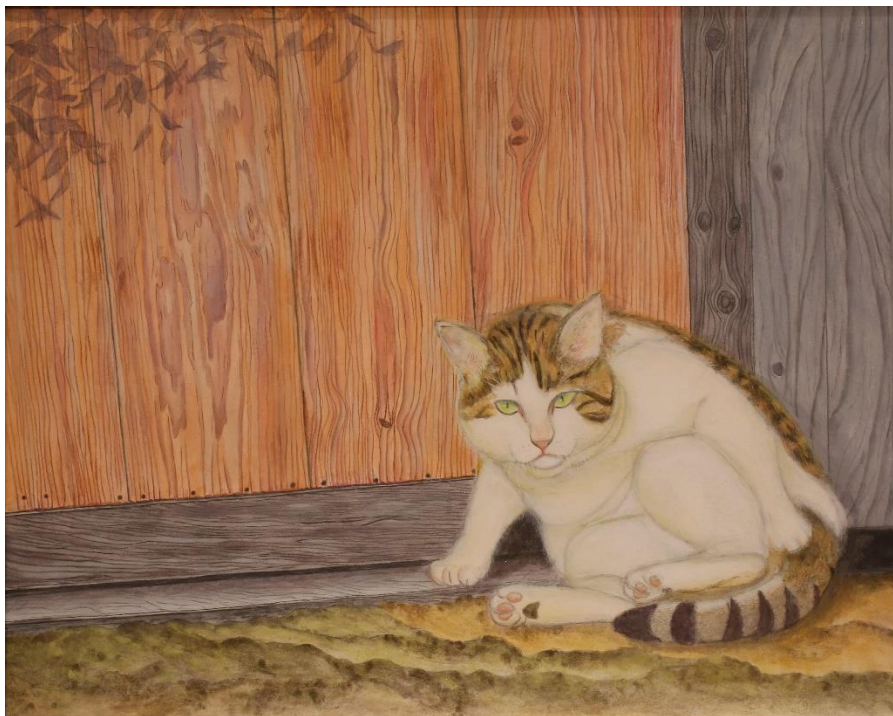
平面部門 No. 1 三井 厚子 《好日》 72.7×91.0 日本画