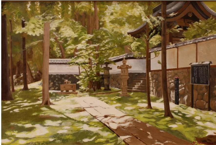
平面部門 No. 31 長谷川 靖 《緑陰》 60.6×91.0 油彩