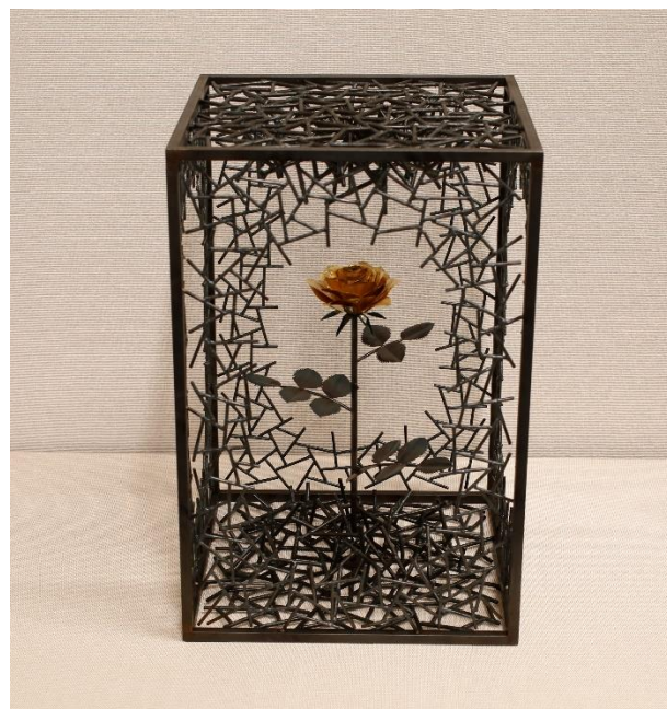
立体造形部門 No. 5 大澤 禎 《想い》 45.0×30.0×30.0 彫刻