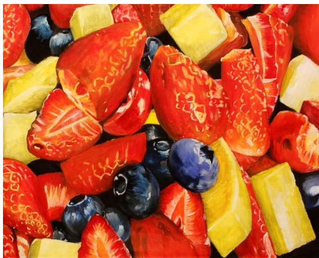
平面部門 No.47 野村 由依 《果実》 80.3×65.2 アクリル