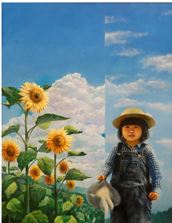
平面部門 No. 10 児玉 尚也 《夏想》 116.7×91.0 油彩