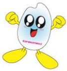
佐久市浅科 イメージキャラクター コメコメっち