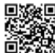
佐久市議会 インターネット映像配信