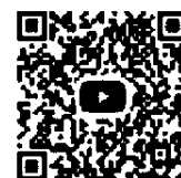
YouTube 佐久市議会チャンネル