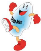
佐久市浅科 イメージキャラクター ライスマン