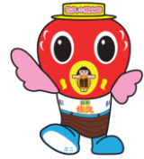
佐久市特別観光PR大使 佐久の鯉太郎ミニ

議員は、選挙で選ばれた市民の代表であり、定数は 条例で決められています。任期は4年です。 (議員名簿は本書14ページ)