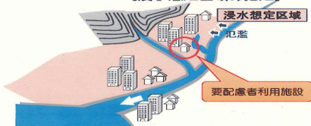
【浸水想定区域の指定】

※「洪水浸水想定区域」とは、河川が氾濫した場合に浸水が想定される区域であり、河川等管理者である国または都道府県が指定します。