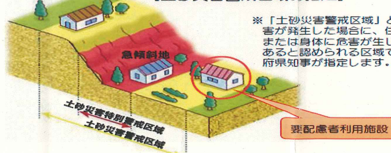
【土砂災害警戒区域の指定】

※「土砂災害警戒区域」とは、土砂災害が発生した場合に、住民等の生命または身体に危害が生じるおそれがあると認められる区域であり、都道府県知事が指定します。