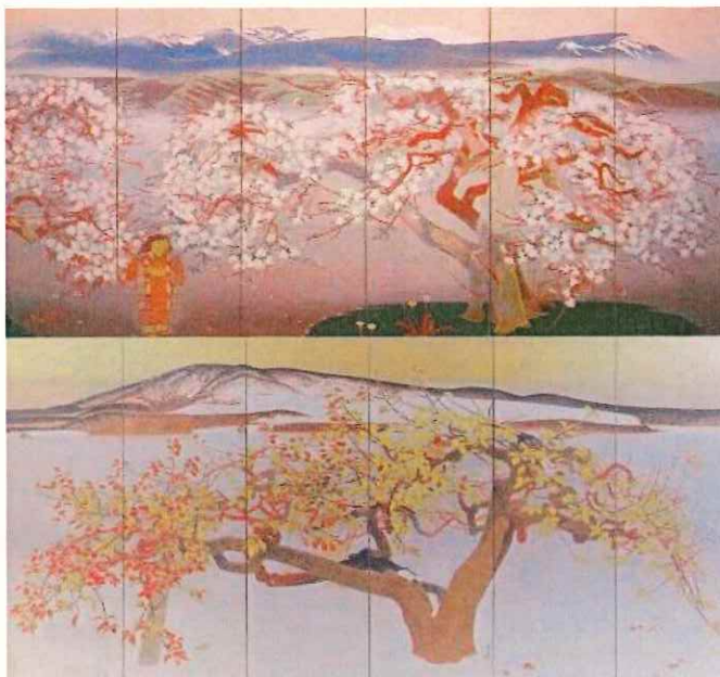
上 《果樹園二題 北ぐにの春》/下 《果樹園二題 冬来る頃》

岩橋 英遠(いわはし・えいえん/1903-1999)は北海道生まれの日本画家です。