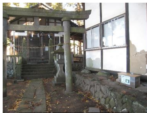
スタンプが設置された 横根地区の諏訪神社

子どもたちには、学校教育で得た学びをもとに、それぞれが自分の幸せを意識しつつ、多様な社会の中で、他者と共存していく持続可能な社会をつくっていきけるよう、成長していったほしいと思います。そのために、学校職員や保護者・地域の方にもコミュニティスクールの存在や活動についてもっと周知できるように、そして、学校教育が社会教育につながっていきけるよう、日々の教育活動に取り組んでいきたいと思っています。