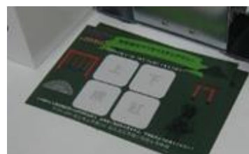
スタンプラリー台紙

本校では、今年度6年生が区長さんをはじめ地域の方に御協力いただいて、地域を巡るスタンプラリーを作成し、地域をPRしようと活動しています。自分の住んでいる地域の良さや史跡・歴史を学ぶことで、自分の地域を改めて再発見し、誇りを感じることができました。学校職員も自分たちの学校の地区をまわり、児童生徒の学びに活かせるよう研修を行っていますが、地域の方との活動が充実することで、さらに広く深まりのある学習ができるのではないかと思います。