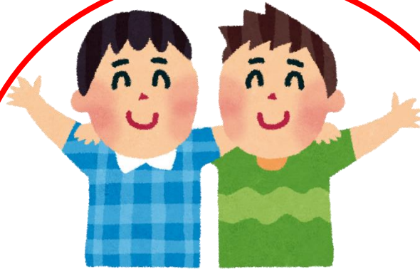
多世代交流グループ