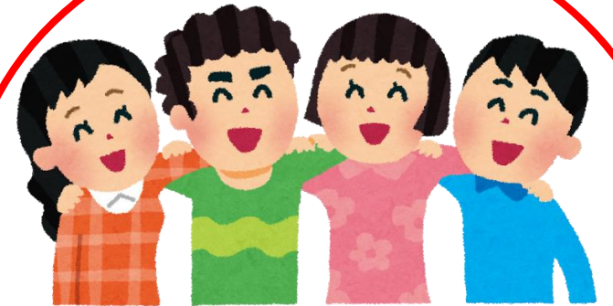
子育て支援グループ