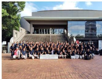
【日本 PTA 川崎大会の長野県の PTA の皆様】