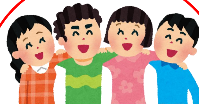
子育て支援グループ