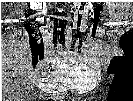
封筒で作った魚釣り