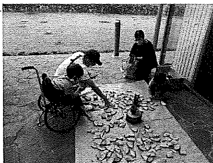
木っ端でキーホルダーをつくろう