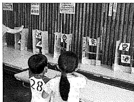
割りばし鉄砲の射的