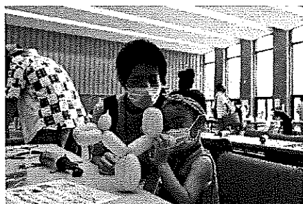
バルーンアートづくり