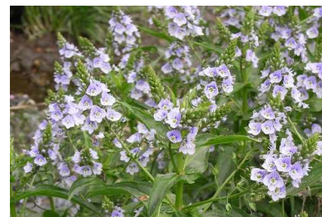
オオカワヂシャ（特定外来生物）