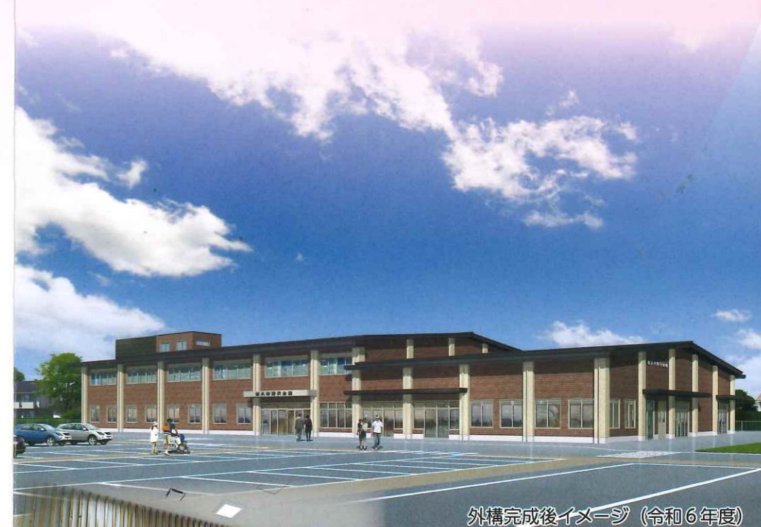
外構完成後イメージ (令和6年度)