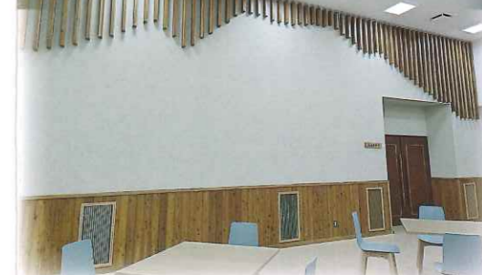
つどいの広場 (浅間山モチーフデザイン)