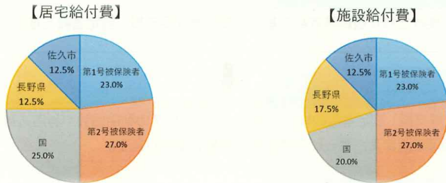
図表 6 - 1 介護保険給付費の財源

介護保険給付費の財源の負担割合は、国 25%（施設給付費分は 20%）、県 12.5%（施設給付費分は 17.5%）、市町村 12.5%、40～64 歳までの第 2 号被保険者 27%、65 歳以上の第 1 号被保険者 23%の負担率となっています。なお、国が負担する 25%のうち 5%の部分は調整交付金で、第 1 号被保険者の年齢構成及び所得水準に応じた率により調整され交付されます。