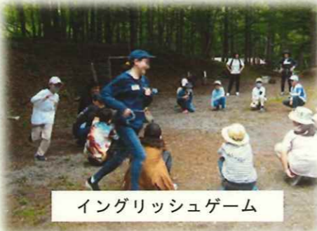
イングリッシュゲーム