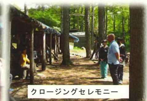
クロージングセレモニー