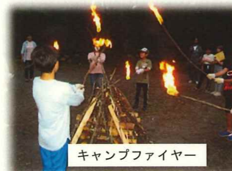
キャンプファイヤー