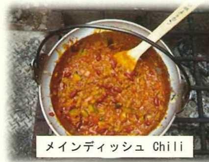
メインディッシュ Chili