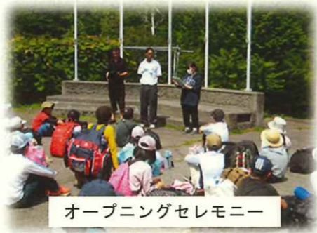
オープニングセレモニー