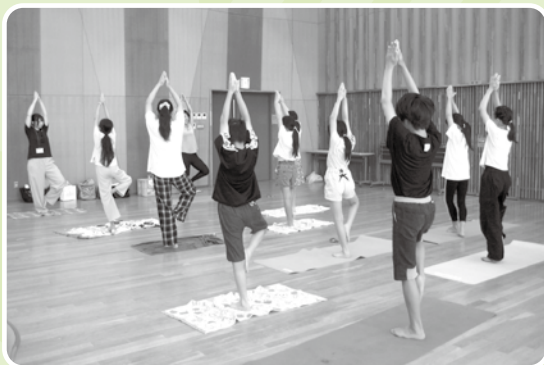
実際に体を動かし、基本的なポーズや呼吸法に挑戦しました。