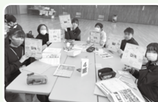
1年間、活動を共にした研修生同士で色紙に感謝のメッセージを書き合い、交換をしました。一人一人が時間が足りないくらい一生懸命書きました。