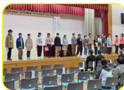
ジュニアリーダー研修生の成果発表の様子