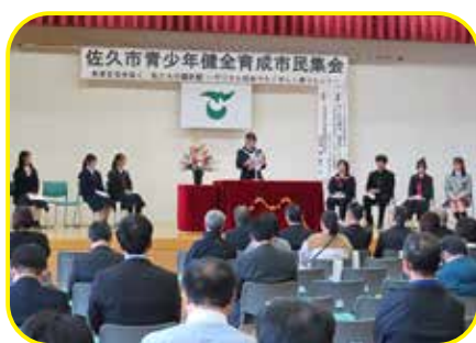
中学生意見発表の様子