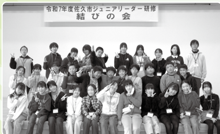
最後に研修生・ボランティアスタッフで記念写真を撮りました。研修生達がこの研修での出会いを大切に、今後、地域の子ども会等のリーダーとして活躍してくれることを願っています。