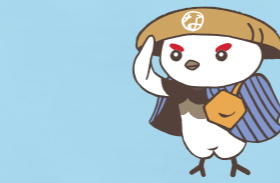
学び応援キャラクター「信州なび助」 ©長野県教育委員会信州なび助