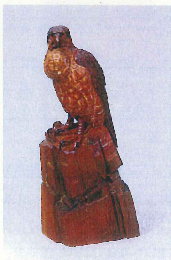
中村直人「鷹」(小杉放菴記念日光美術館蔵)