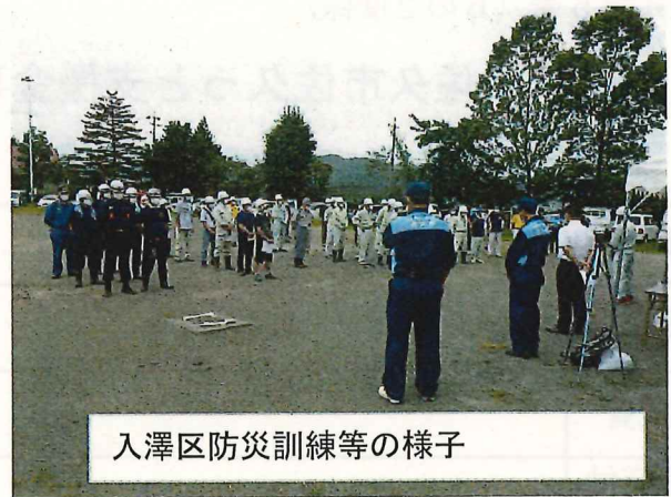
入澤区防災訓練等の様子