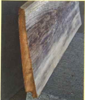
外壁の下見板断面