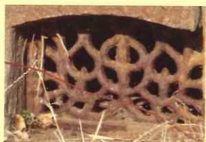
基礎石換気口の面格子