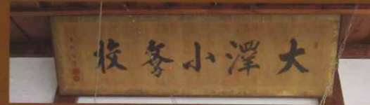
揮毫は大給恒（信濃田野口藩主。老中、陸軍総裁。明治維新後は賞勲局総裁、日赤の創設者の一人）