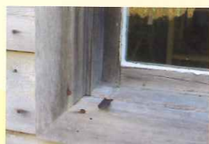
窓敷居の水落とし