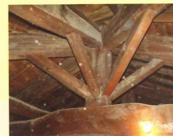
東西2カ所ある隅部周りの木組み

旧大沢小学校の堂々とした佇まいは見る人を驚かさず。実際、高さは棟木天端までが11.4mある。教室内は床からの天井高が3.1m、2階図書室は3.28mもある。そのためか、柱や梁などの構造材が太い。特に豪快な小屋組みには圧倒される。見た目はトラス構造を模った洋小屋風で陸梁の両端から屋根勾配に沿って三角形の合掌材が組まれている。陸梁の上に対策が立ち二重梁を乗せ、その上に真束と方杖で棟木と合掌を支えている。とりわけ、東西2カ所ある隅部が見事で、棟木と5本の合掌斜材を突き上げるように支えている隅真束と五方杖周りは驚きの木組みで、高度な規矩術の見本のようなもの。これらは、いずれも太い太鼓材が金具なしで生まれ、陸梁の上には添え梁まで乗っている。屋根材の加重は相当なものと思われるが、それを支えている柱も太い。今も保存されている新築目論見帳によると通し柱が50本使われ、内訳は7寸角が8本と6寸角が42本となっている。これらの構造材を差し金一丁で墨付け加工し、建設機械などない時代どりの様に持ち上げ組み立てたのが想像するのも難しい。屋根裏は電灯がとり見学も可能です。