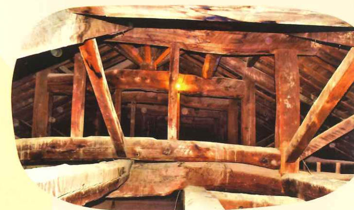
対東トラスを模った洋小屋風小屋組