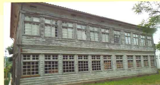
校舎北側、白ペンキも残り木枠のガラス窓が味わい深い

校舎新築費用は総額3,425円。地ならし代649円、植手間代424円、大工手間代383円、建具代297円、敷地購入代294円などで、資金源は、村費200円、残りは村民の寄付金2,040円と村共有林からの材木代による。動力や機械のない時代、敷地の地ならしから木材出し、製材、加工、組み立てなど全てが人の手によって造られた。学校の用材は地元産のカラマツとアカマツだ。大沢村は林業立村として知られ、明治の早い時期から林業に力を入れていたが、当時はまだ天然林も多くあったに違いない。木を伐採し山で皮むきをしたため、山が真っ白になったと伝わっている。