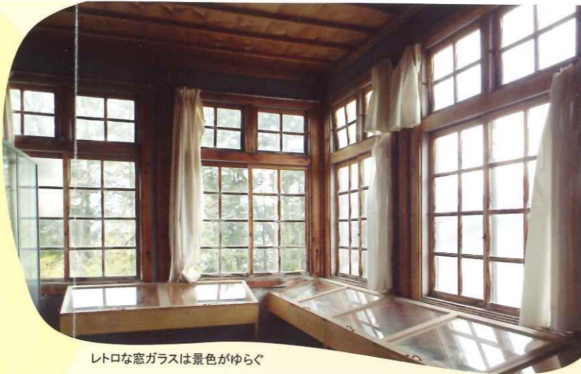
レトロな窓ガラスは景色がゆらぐ

骨太学校はごついだけではない。文明開化期のモダンな空気も残している。玄関と2階講堂入り口の上に半円形のガラスの欄間を付け、2箇所の踊り場付き階段はろくろ加工の手すり子や親柱は優雅で丁寧な造りだ。外壁材は南京下見板でしゃくり付き、四方に胴蛇腹を廻しアールを付けてそのまま軒天を張り、真っ白くペンキが塗られた。ガラス窓の上部に霧よけ いせ 底、敷居には3カ所水落としを付け雨仕舞いに工夫を凝らすなど細かいところまでこだわった職人らの熱い想いが伝わってくる。