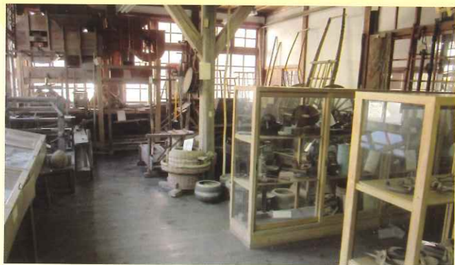
第1資料室（農具等民俗資料）

校内には、学校建設の際出土した鉄剣や土器・石器を初め、県内では数少ない板碑が何枚も保存されている。また、使い込まれた生活用品や汗の染み込んだ農具などの民俗資料が3教室一杯に収集展示されている。これらは、明治・大正・昭和の暮らしや農業を知るうえで貴重な文化遺産であり歴史の生き証人と言えます。