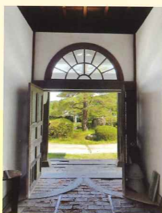
玄関、上に半円形のガラスの欄間、たたきはレンガ敷き