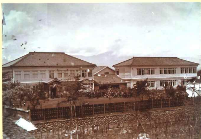
明治41年5月1日雨天体操場と東校舎新築落成式（左側が現存している本館）

近代学校建築は、明治5年の「学制」の頒布と共に始まった。当初は、文明開化の波に乗り、ペランダや塔屋を設け、窓は小さめで上げ下げや開き窓の付いた漆喰壁の学校が造られた。しかし長続きはせず明治10年代でほぼ終息している。明治20年代になると外壁は漆喰から下見板張りが主流となり、窓は大きく開けられ引き違いのガラス窓の入った学校が造られるようになった。形は多少違ってもこの2点は共通で、以後戦後のRC造りに変わるまで日本全国津々浦々に造られた。一方、学校と言えば、どこへ行っても一目で分かるほど人々の記憶の中に溶け込み、今では、懐かしい木造校舎のイメージ像として親しまれている。旧大沢小学校は、そんな全国に普及したいわばスタンダードな木造校舎スタイルの先駆けて、外観の派手さはないが、文明開化期のデザインなども残し、シンプルで洗練された美しさは懐かしい木造校舎のシンボリック存在です。