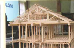
旧大沢小学校（本館）軸組模型 （信州大学工学部建築学科 梅干野研究室製作）