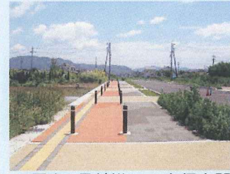
■ 原東1号線沿いの歩行空間