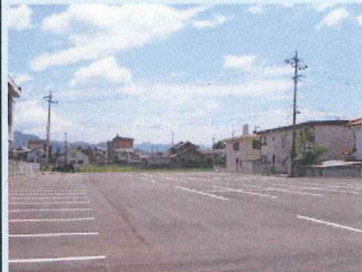
■ 浅間体育センター駐車場